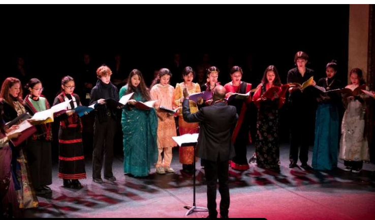
Concert au Théâtre de Saint-Omer